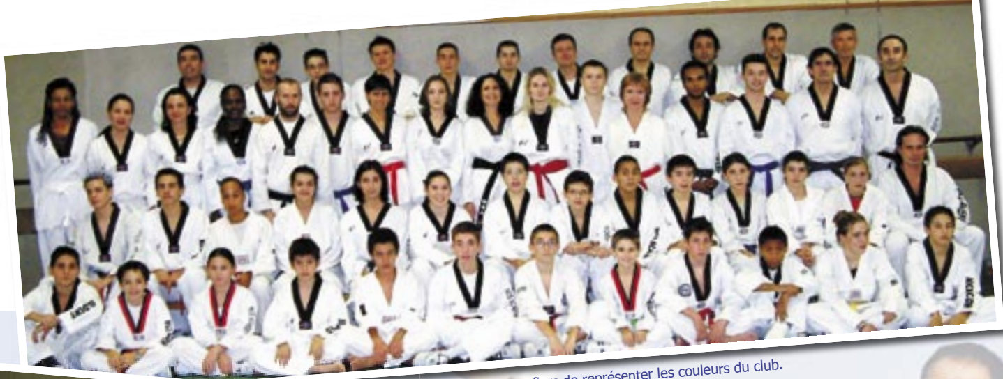
Adultes et ados fiers de représenter les couleurs du club.